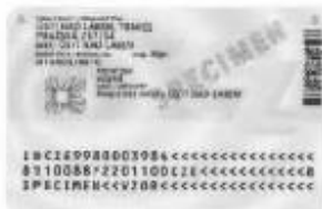
Zadní strana (bez čipu)