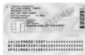
Zadní strana (s čipem)

Od 1. 1. 2012 je vydáván nový občanský průkaz se strojově čitelnými údaji (s čipem nebo bez čipu). Je vyroben ve formě plastové karty o rozměrech 54 mm x 85,6 mm (velikost platební karty), má gravírovanou černobílou fotografii a gravírovaný podpis držitele. Jméno, příjmení a číslo dokladu jsou provedeny taktilním gravírováním (lze poznat hmatem). Oba občanské průkazy jsou vzhledově stejné, liší se pouze tím, že na zadní straně je umístěn kontaktní elektronický čip.